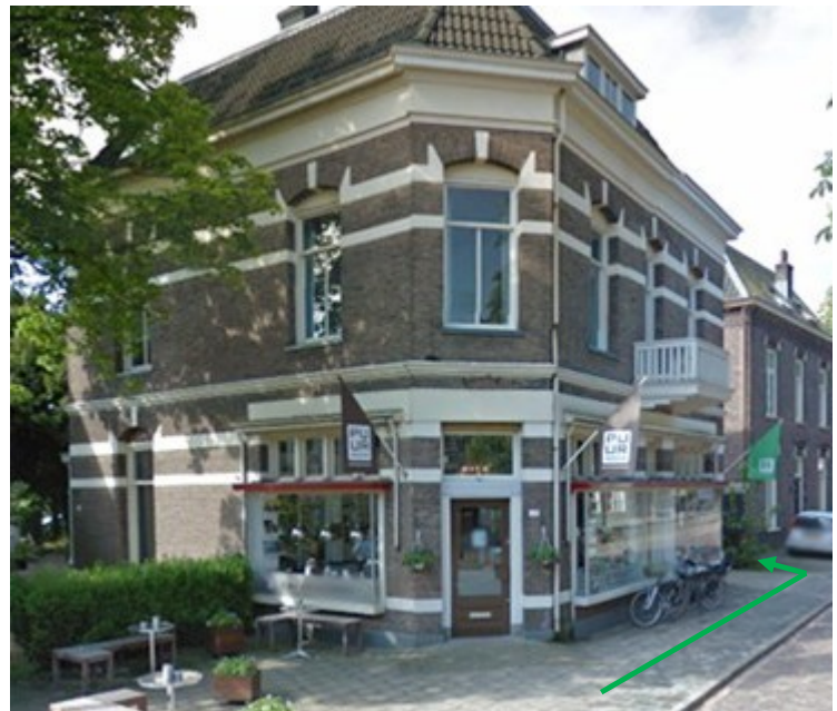
Cas Koffie (Coachhuis is om de hoek!)