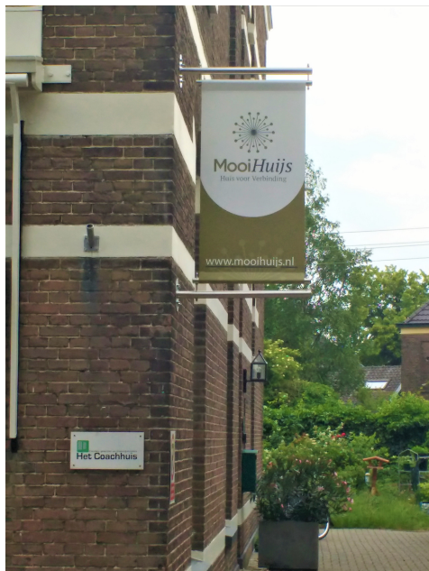
Let op: ingang Het Coachhuis is aan de zijkant van het pand

Het Coachhuis Velp ligt op de hoek van de Emmastraat en de pastoor Koenestraat, naast en boven "Cas Meer dan Koffie". De ingang van Het Coachhuis is in de inrit tegenover de school . Aan de muur zie je een banner van Mooihuijs en een bordje met Het Coachhuis: